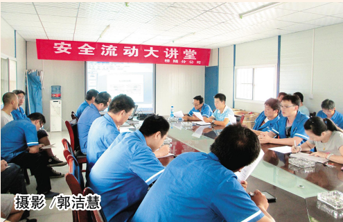
为了加强职工的安全意识,营造良好的安全生产环境,桥隧分公司近期开展了安全流动大讲堂活动,图为环南路项目部学习现场。